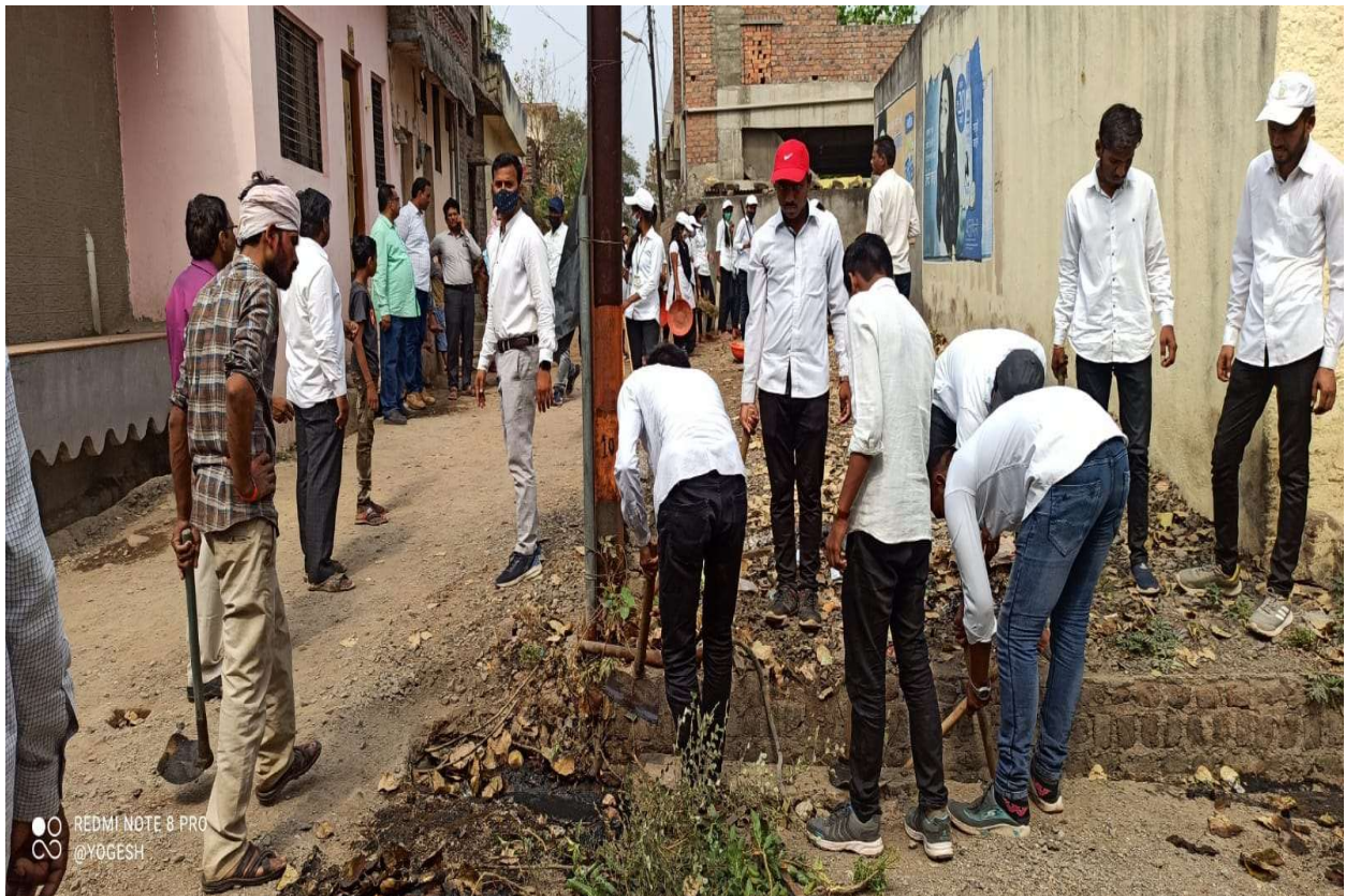
Participation Cleaning campaign in Morewadi