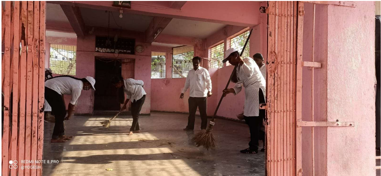
Cleaning of Morewadi village temple