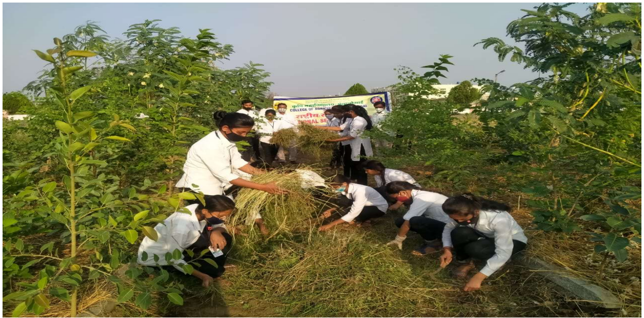
Demonstrations- Mulching with sod under the trees during summer conditions