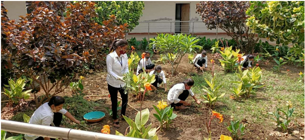
Participation in College cleaning campaign