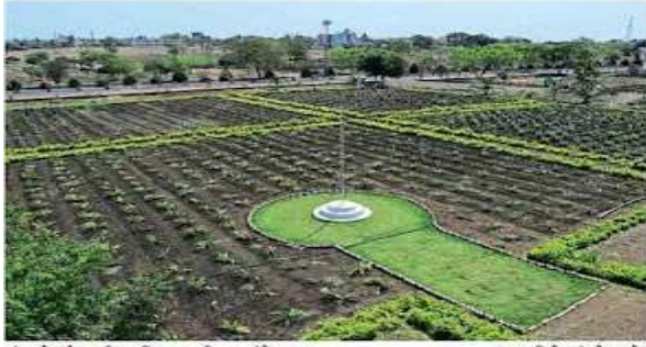
अंबाजीमार्ग : कुशी महाविद्यालयातील फुलांचे उद्यान.