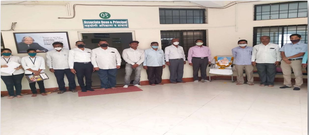
Celebration of Saint Gadge Baba Jayanti- A messenger of cleanliness in society