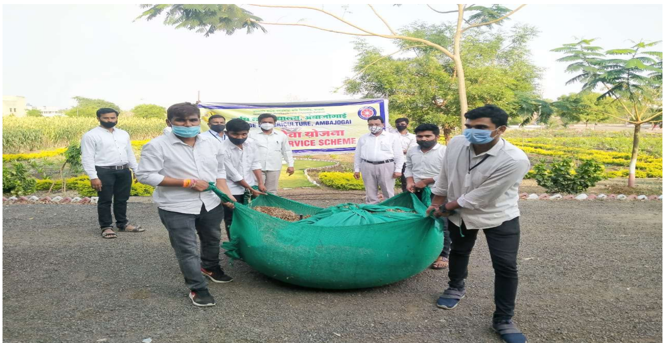
Participation in College cleaning campaign