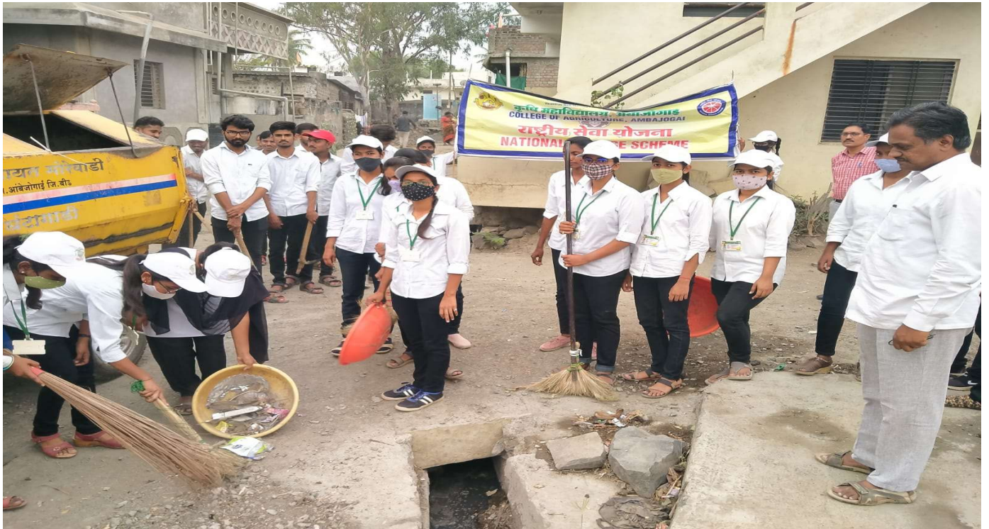
Participation Nala cleaning done in Special Camp at Village Morewadi