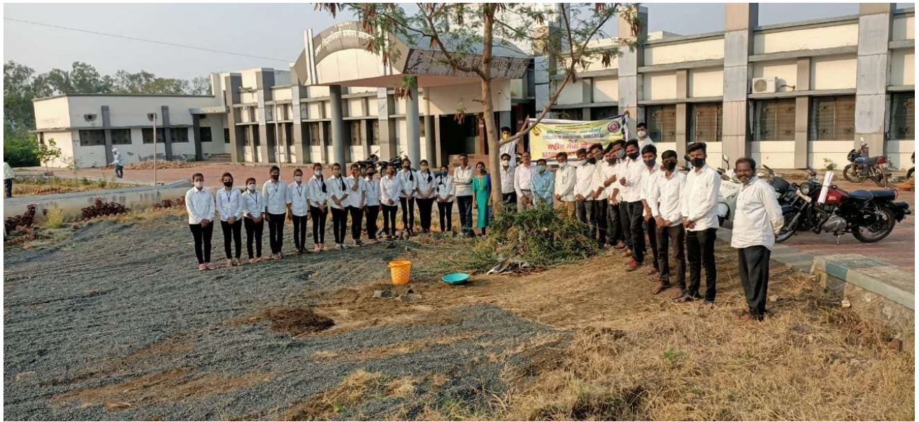
Participation in cleaning campaign of i Dy. Collector Office, Ambajoga