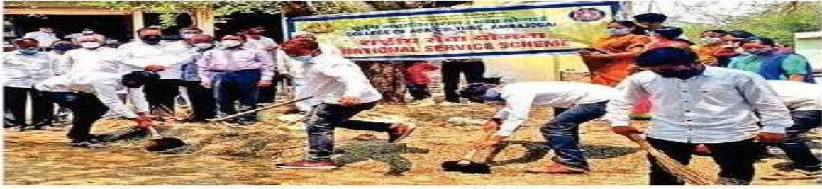
अंबाजोगाई : रासेयो शिबिरात सहभागी विद्यार्थ्यांनी गाव परिसरात स्वच्छता अभियान राबवले.