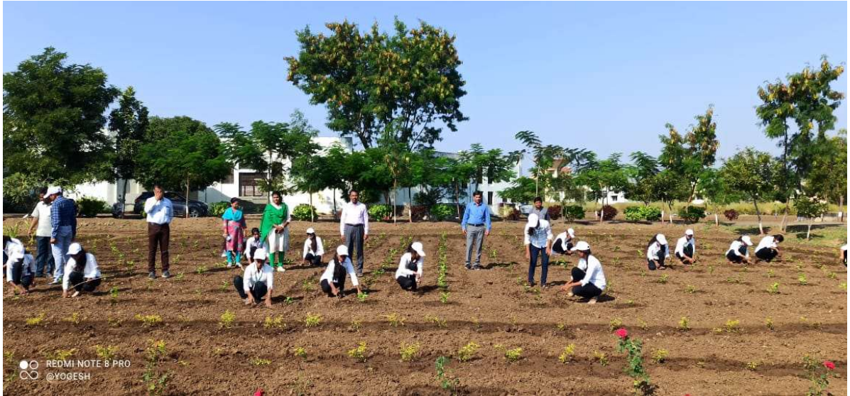
Working in college NSS Garden