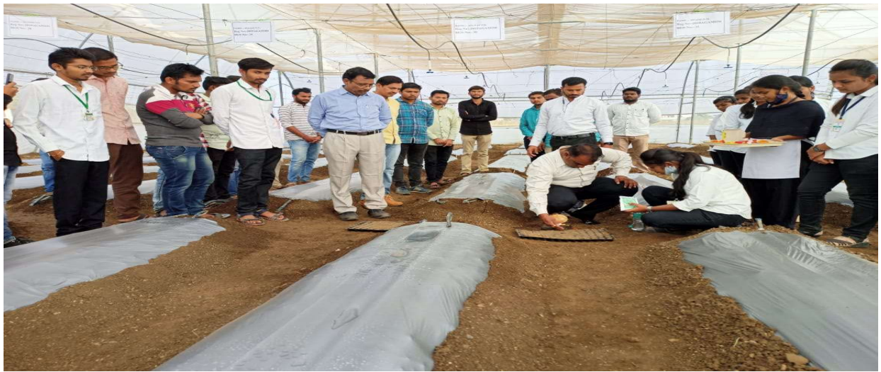
Mulching on raised beds in polyhouse to conserve moisture