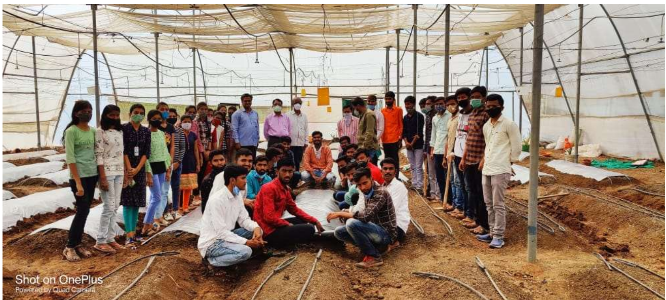
Shot on OnePlus Powered by Quad Camera

Teaching and demonstrations of mulching in crop production and also in standing was made regular practice by NSS students in college