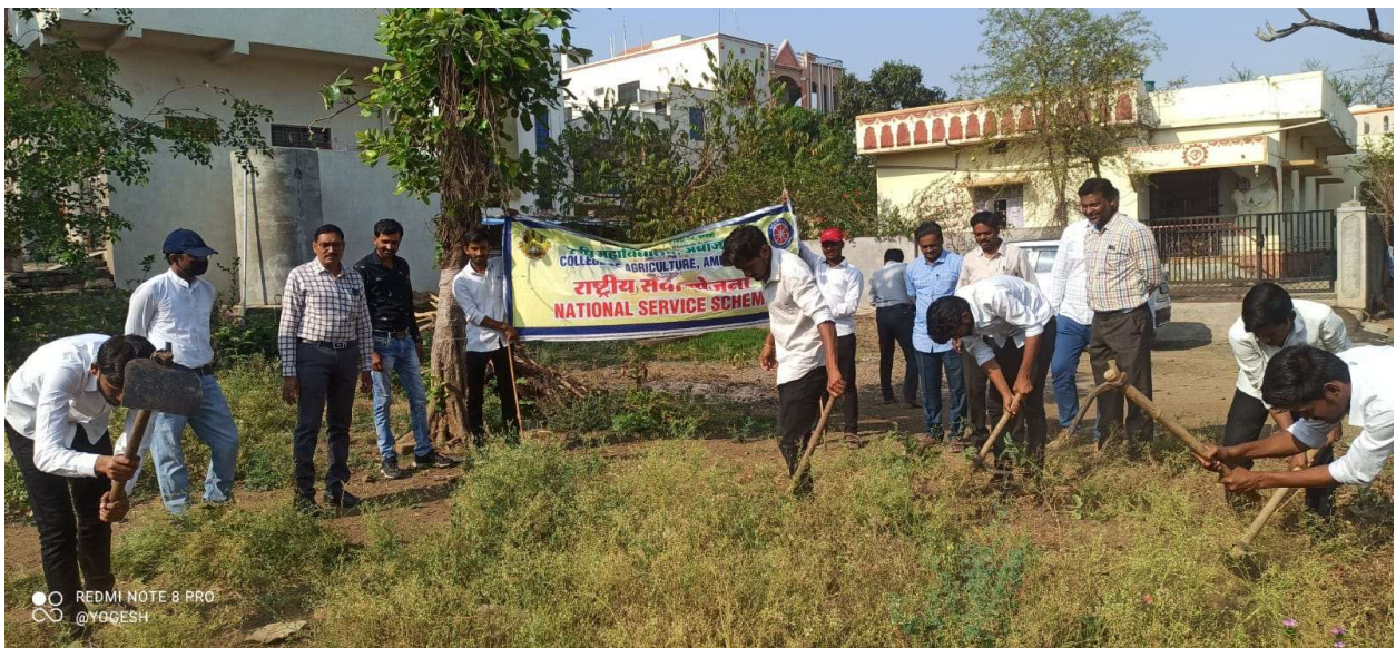
Participation in Parthenium Eradication Programme