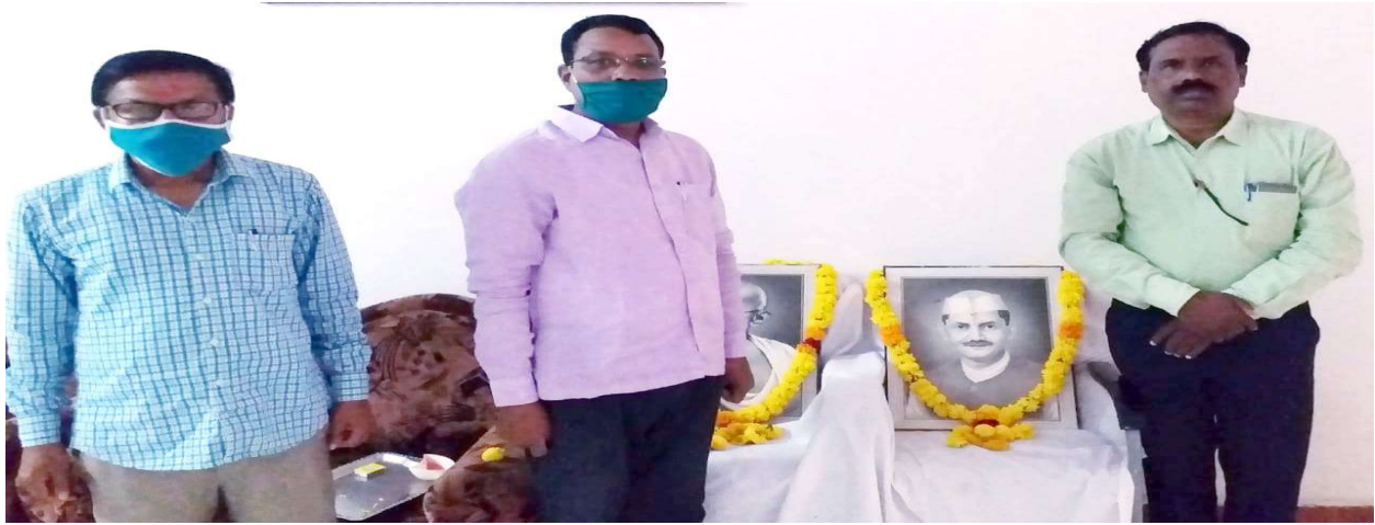
Celebration of Mahatma Gandhi Jayanti