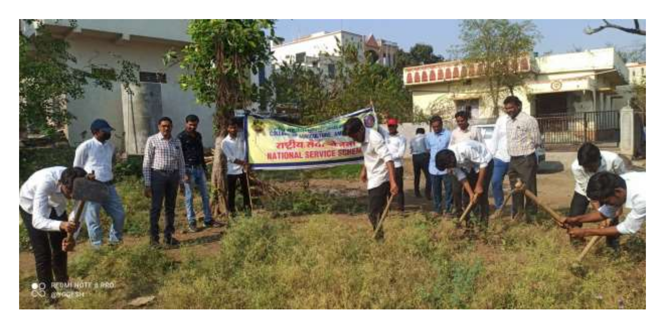
Participation in Parthenium Eradication Programme