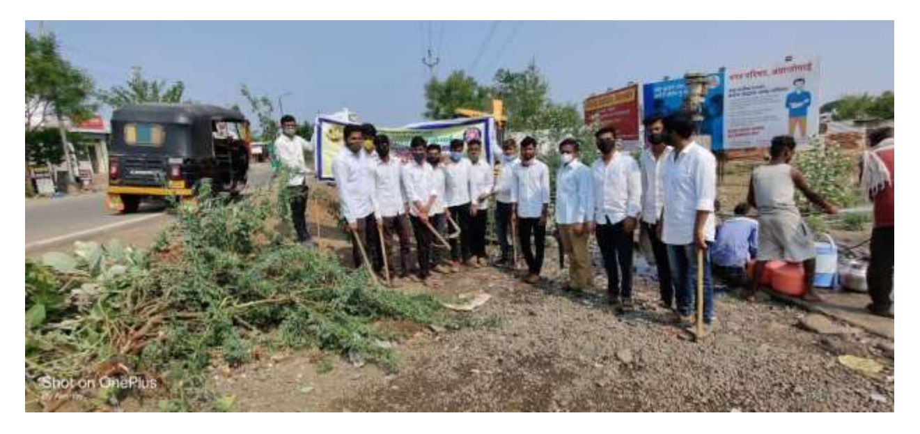
Participation in Ambajogai cleaning campaign